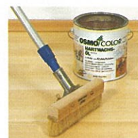
■オスモワイドブラシ 幅230mm フロアクリアーの塗装には立ったままで塗れるコレを。 (120cm柄付き)

しかも乾燥4~5時間、1日に2回塗り可能 ワイドブラシを使えば施工スピード大幅アップ