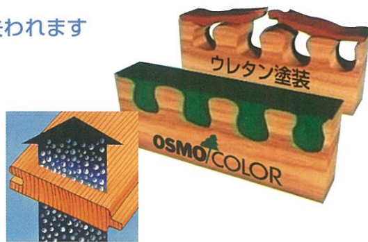
木は呼吸をしています

ウレタン塗料の多くは塗膜を形成して、ビニールを被せたのと同じ状態になり、木の呼吸も妨げます。そのため木のもつ調湿機能が損なわれ、木を使った意味が失われます。また塗面のワレ・ハガレ・メクレが起き、塗り替え時に全剥離が必要で、余分な時間がかかります。